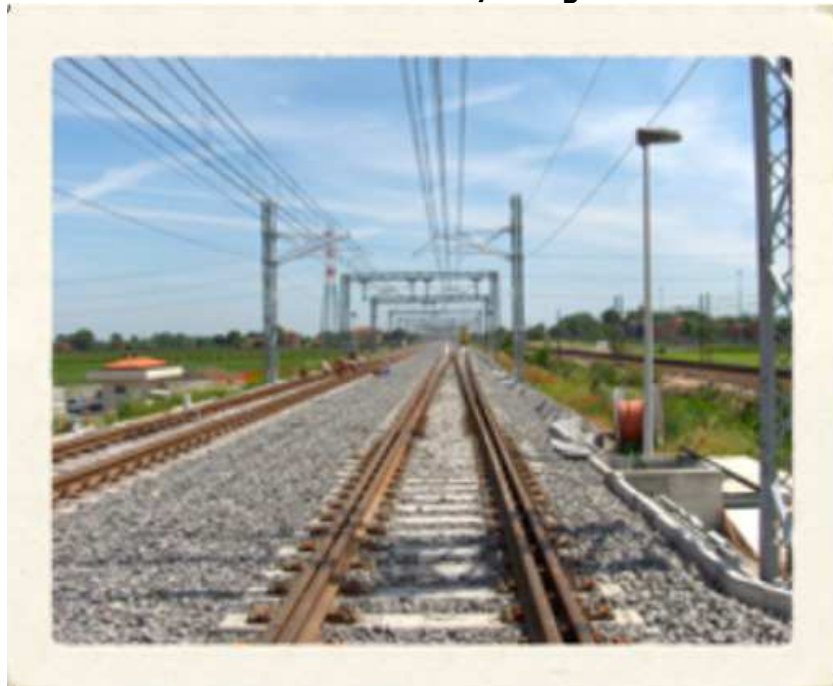
Costruzione Ponti Provvisori Bologna