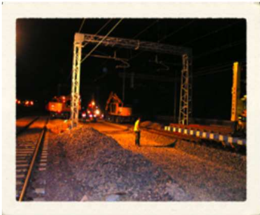
Raddoppio Linea Bologna/Verona