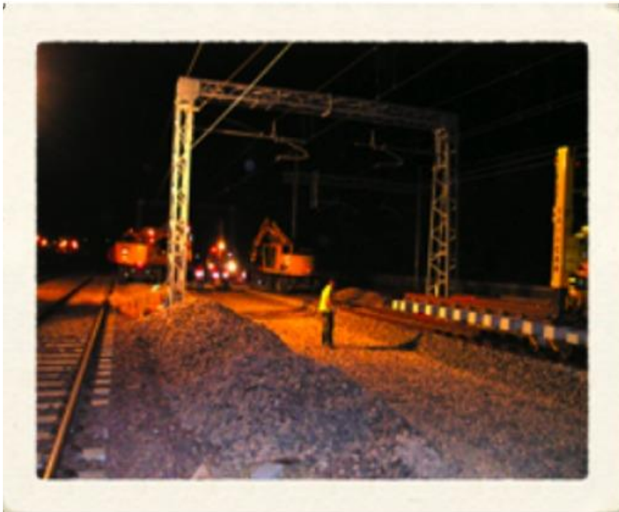
Raddoppio Linea Bologna/Verona