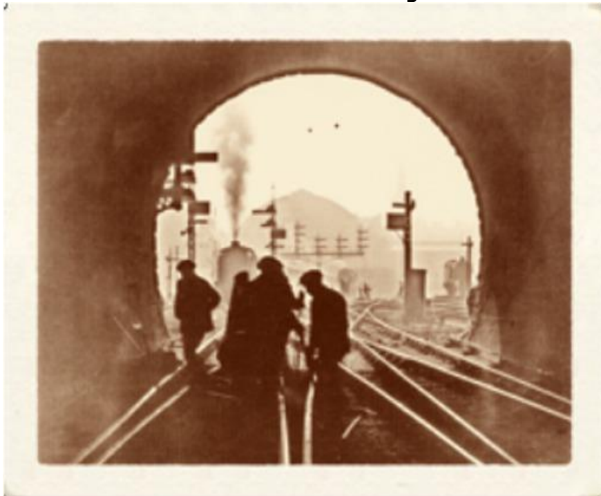
Livellamento binari sul ponte Traslagunare di Venezia